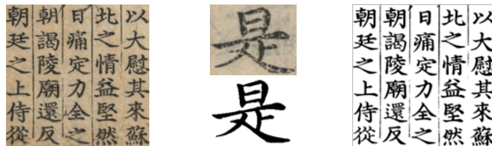
금속활자 인쇄물인 주자대전(을해자/16c) 복원 사례(좌) 원본(우) 디지털 복원