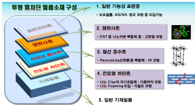
[열차단 복합필름의 구성을 나타낸 단면도]