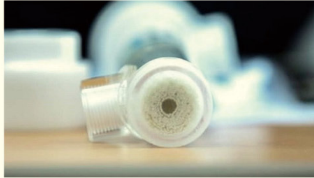
고효율 컴팩트 막접촉기를 활용한 CO 2 포집 기술