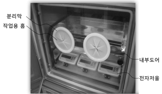
[본 장치의 메인 도어의 창을 통해 본 구현 이미지]