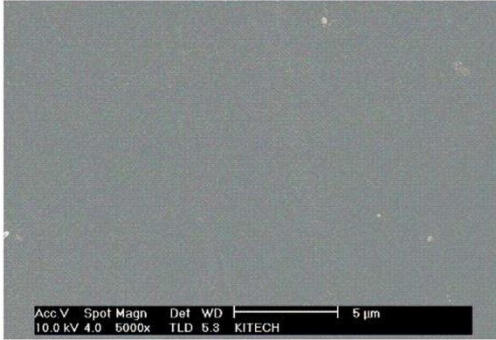
[코팅된 보호막의 미세조직 사진]