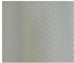
(CMC섬유포, 면소재의 부직포가 함포되어 이루어진) [본 기술에 따른 흡수코어(좌), 겔화된 상태(우) 사진]