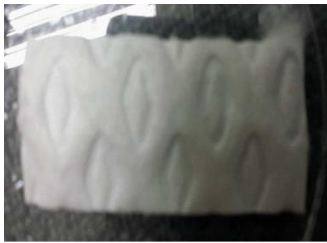
(CMC파이버, 면소재의 부직포가 함포되어 이루어진) [본 기술에 따른 흡수코어(좌), 겔화된 상태(우) 사진]